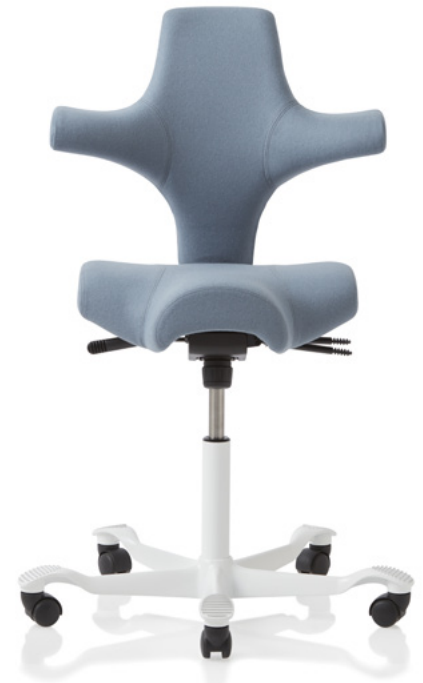
Ontwerp: Peter Opsvik. Geregistreerd en gepatenteerd model